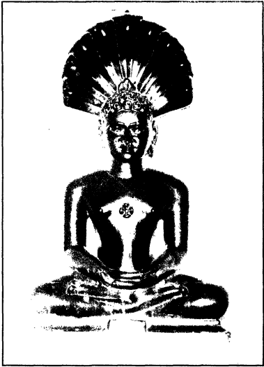
भगवान पार्श्वनाथ जी, गिरिराज मंदिर, पालीताणा